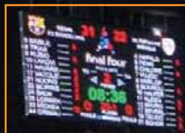
Marcador & software