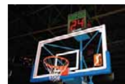
Módulo de 24 segundos