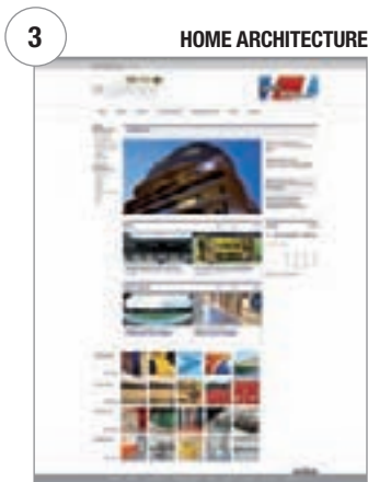
In diesem Bereich können die verschiedenen Projekte nach Art des architektonischen Vorhabens gesucht werden (Hallen, große Stadien, usw.)