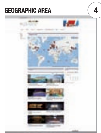
In diesem Abschnitt können die geografischen Standorte der analysierten Projekten mit Hilfe von Google Maps gesucht werden.

BESUCHEN SIE UNS AUF DER INTERNETSEITE www.spaziomondo.com !