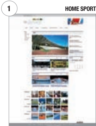
In diesem Bereich können die verschiedenen Projekte nach Sportdisziplin gesucht werden (Leichtathletik, Basketball, Fußball, usw.)

Entdecken wir nun im Detail die Inhalte der verschiedenen Bereiche von www.spaziomondo.com