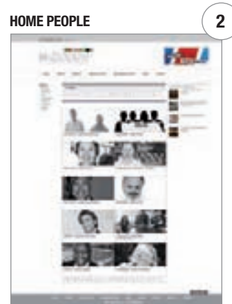
Den Persönlichkeiten gewidmeter Bereich: Architekten, Designer, Sportler aus aller Welt, die in den Artikeln auf der Homepage genannt werden, oder damit in Verbindung stehen.