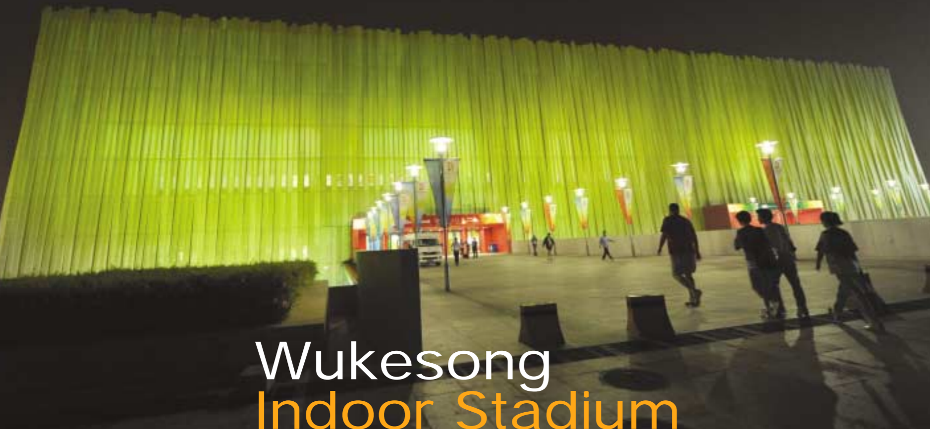
Wukesong Indoor Stadium