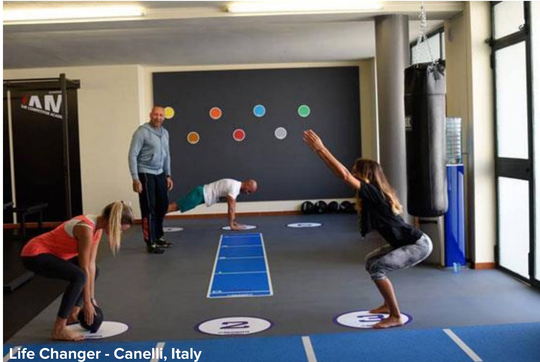
Life Changer - Canelli, Italy

Sistema a muro: spessore: 36 mm Dimensione piastre : 91 x 58 cm