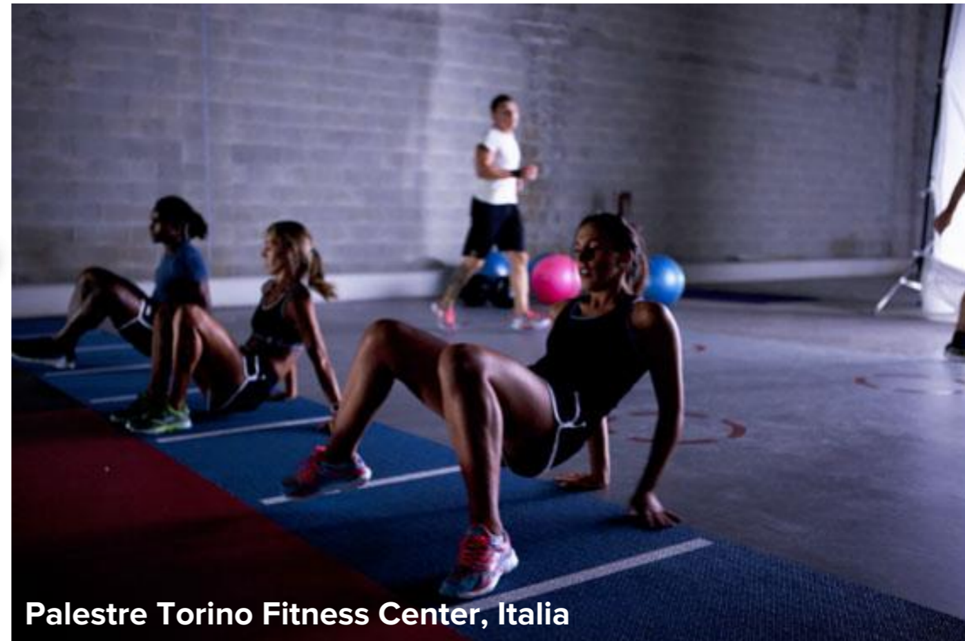
Palestre Torino Fitness Center, Italia

Perfetto per: allenamento funzionale, allenamento atletico, esercizi di velocità, sprint e salti