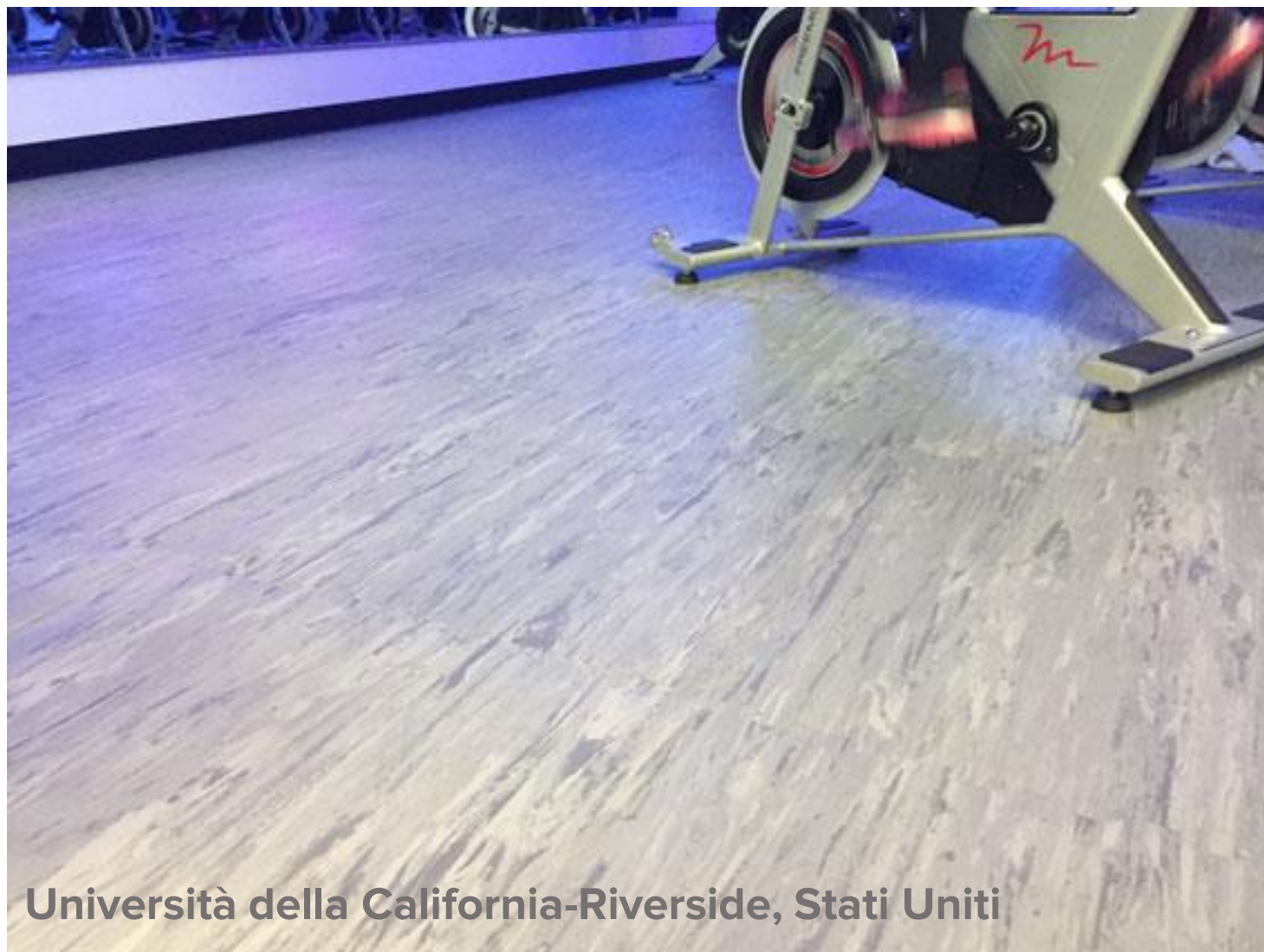
Università della California-Riverside, Stati Uniti