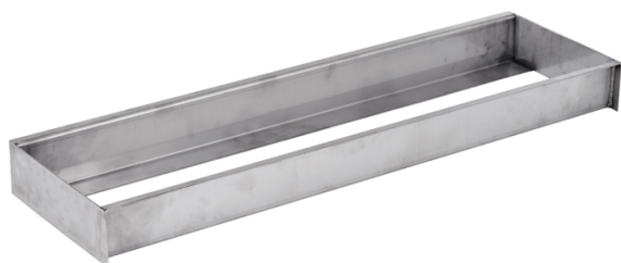
Tabla de batida de acero inoxidable (AT010)

Diseñada, fabricada y homologada conforme a la normativa de la Federación Internacional (Certificado IAAF E-99-0181).