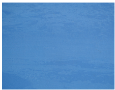
A25 ROYAL BLUE